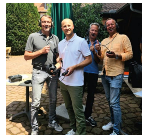
Intensives Training ... Intensive training ...

Intensive product workshops, exciting news from the worldwide sales territories and, above all, a good time together: This year's International Sales Meeting was a complete success. For three days, colleagues from sales, product management and marketing had the opportunity to personally exchange information on the latest developments, present updates in the product portfolio and present use cases from different target groups. We are already looking forward to the next meeting - see you next year!