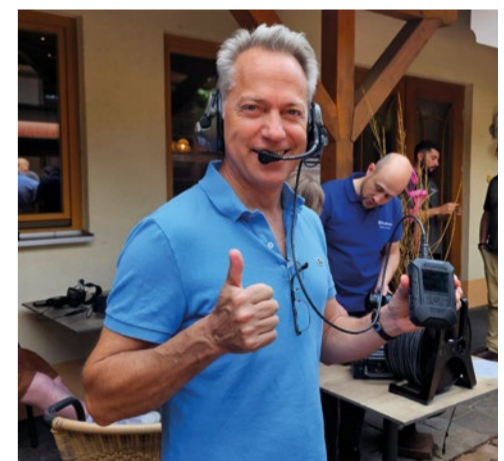
... des CT-DECT Multi – more to come soon! ... of the CT-DECT Multi – more to come soon!