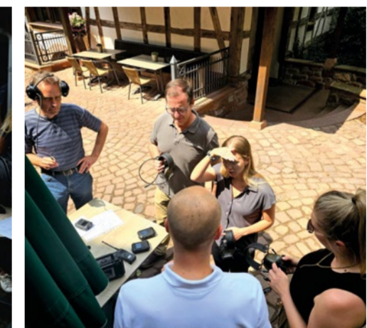
... mit den neuen Upgrades und Features ... ... with the new upgrades and features ...