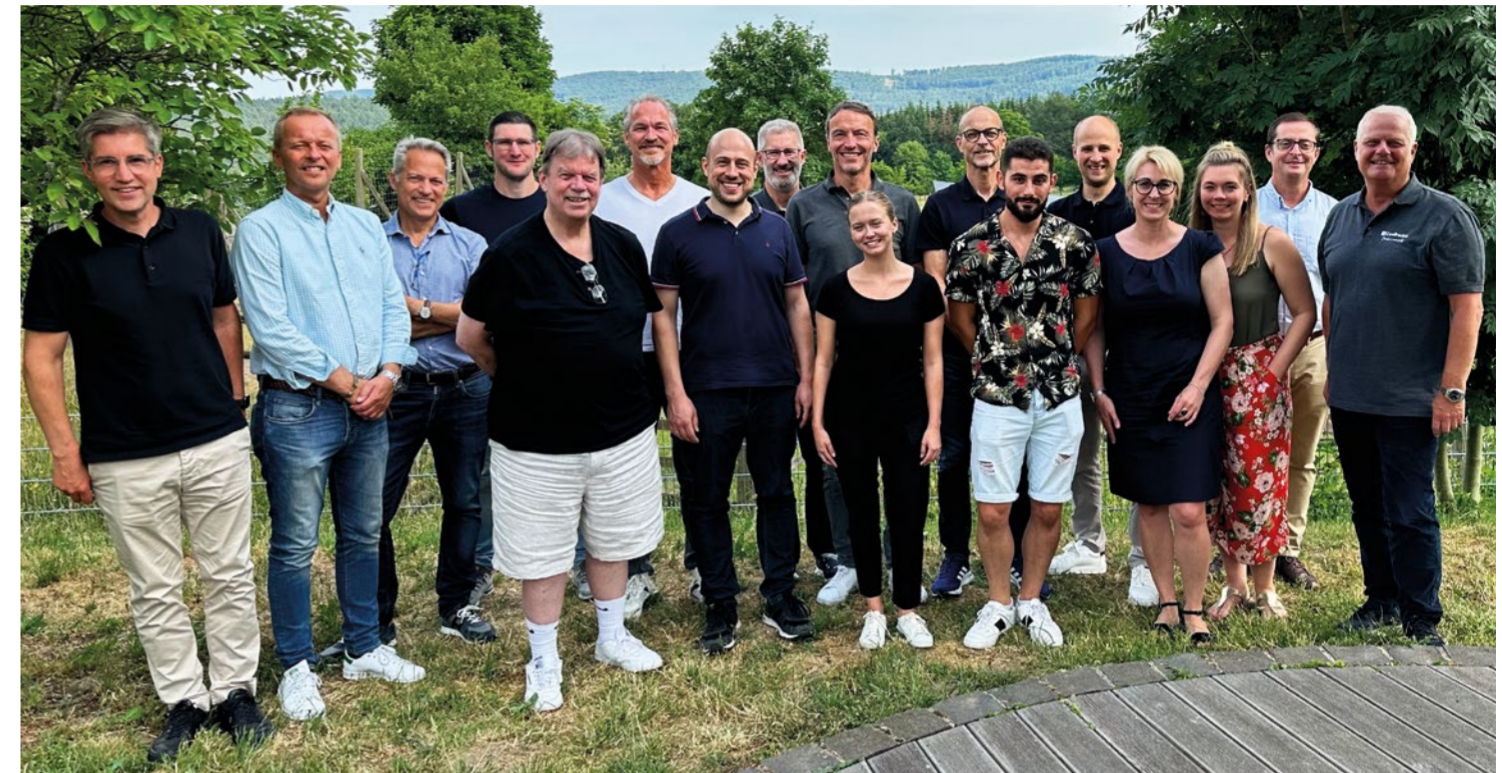
Vertrieb, Produktmanagement und Marketing aus Deutschland zusammen mit den Area Sales Managern aus Frankreich, Schweden, der Schweiz, Spanien und den USA. The German colleagues from Sales, Product Management and Marketing together with the Area Sales Managers from France, Sweden, Switzerland, Spain and the USA.

Intensive Produkt-Workshops, spannende Neuigkeiten aus den weltweiten Verkaufsgebieten und vor allem eine gute Zeit zusammen: Das diesjährige International Sales Meeting war ein voller Erfolg. Drei Tage lang hatten die Kolleginnen und Kollegen aus Vertrieb, Produktmanagement und Marketing die Gelegenheit, sich persönlich zu den neuesten Entwicklungen auszutauschen, Updates im Produktportfolio vorzustellen und Use Cases aus verschiedenen Zielgruppen zu präsentieren. Wir freuen uns schon auf das nächste Meeting – see you next year!