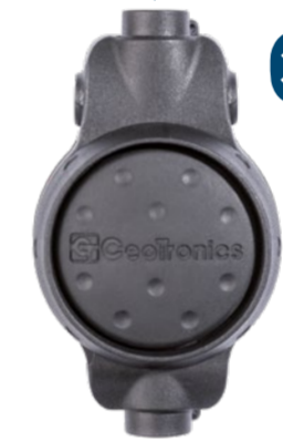
CT-MultiPTT 1C Plus